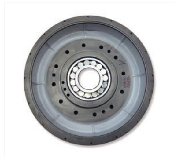
Lagergehäuse mit eingezogenem Pendelrollenlager.

Nicht alles lässt sich immer perfekt planen. Und plötzlich ist es passiert: die Siebmaschine steht. Gut, wenn man jetzt einen verlässlichen Partner in der Ersatzteilversorgung hat. Wir liefern hochwertige Ersatz- und Verschleißteile, auch für Fremdfabrikate, mit kurzen Lieferzeiten – und in dringenden Fällen innerhalb von 24h.