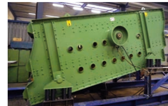
Generalüberholung einer Siebmaschine vom Typ FKP 1550-3 (links: nach Einbau neuer Seitenwände; rechts: Probelauf)